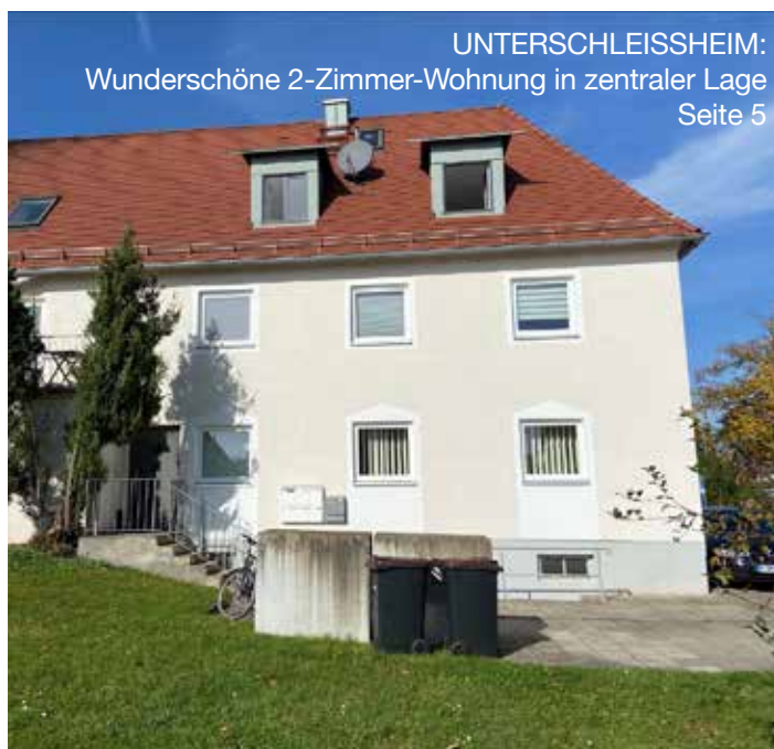
UNTERSCHLEISSHEIM: Wunderschöne 2-Zimmer-Wohnung in zentraler Lage Seite 5