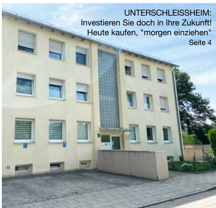
UNTERSCHLEISSHEIM: Investieren Sie doch in Ihre Zukunft! Heute kaufen, "morgen einziehen" Seite 4