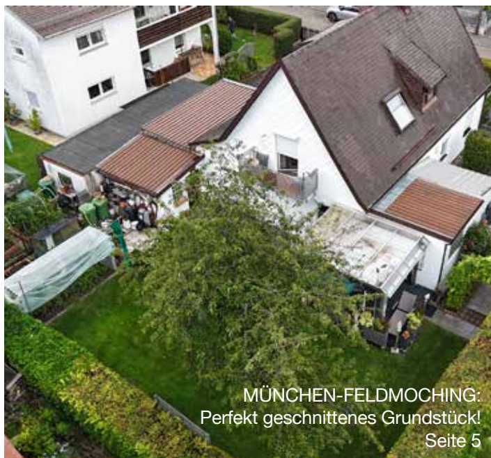
MÜNCHEN-FELDMOCHING: Perfekt geschnittenes Grundstück! Seite 5

Unsere Angebote finden Sie auf den Seiten 4 bis 6.