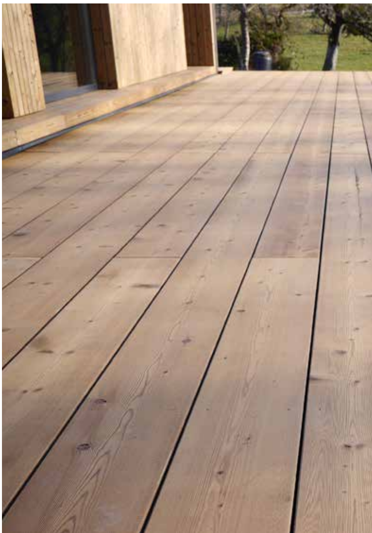
Attraktiv und robust: Heimische Holzarten eignen sich nach einer speziellen Thermobehandlung für den Außenbereich, von der Terrasse bis zur Fassade. Auch die heimische Birke, die in vielen Regionen zum festen Bild in den Wäldern gehört, wird dank der Thermobehandlung deutlich widerstandsfähiger.