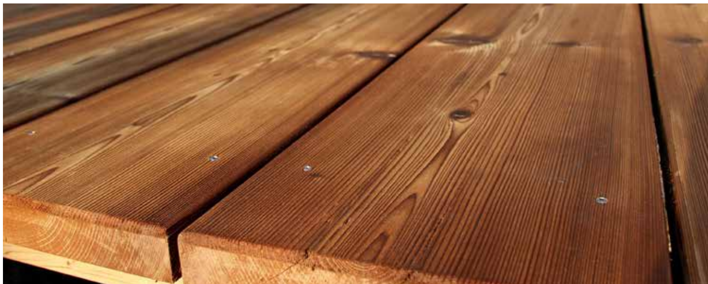
Enorm widerstandsfähiger als zuvor: Heimische Hölzer wie die Thermo-Tanne gewinnen für die Terrassen- und Fassadengestaltung durch eine richtige Thermobehandlung an Bedeutung.